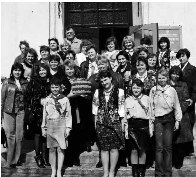
Колектив Заболотцівської загальноосвітньої школи І–ІІІ ст. Львівської області з гостями з Молдови.

Метою зустрічі з українськими колегами був обмін досвідом найкращими практиками реалізації моделі громадсько-активної школи серед шкіл обох країн і налагодження партнерських стосунків між школами. У ході поїздки учасники ознайомилися з досвідом роботи ГАШ у Західній Україні: відбулось дві поїздки до Бродівської гімназії ім. І. Труша та Заболотцівської загальноосвітньої школи Бродівського району Львівської області. Також учасники поїздки мали нагоду відвідати навчально-виховний комплекс «Малюк», що знаходиться в м. Львів.