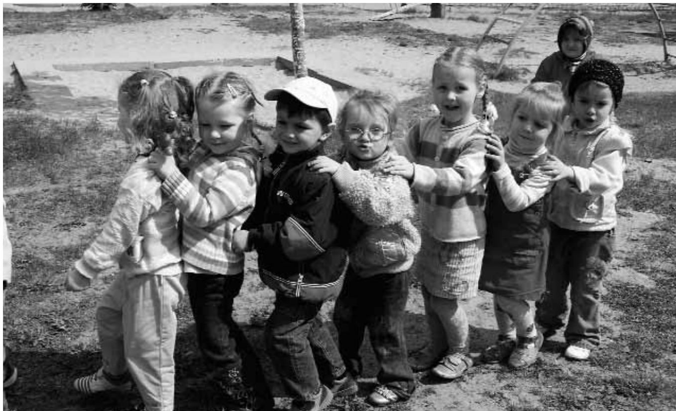
Вихованці школи-дитячого садка «Паросток», м. Київ.