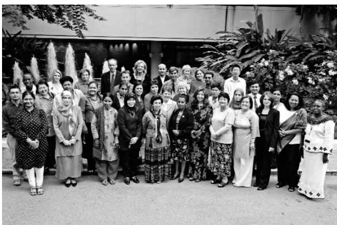
Учасники світового форуму

Конференцію було організовано фондом «Світовий форум», що знаходиться в Сіетлі, Вашингтон, США. Місія фонду — сприяння постійному глобальному обміну ідеями з питань надання якісних послуг дітям з різних країн. Виконуючи свою місію, фонд щороку збирає професіоналів з усього світу, які працюють у сфері раннього дитинства.