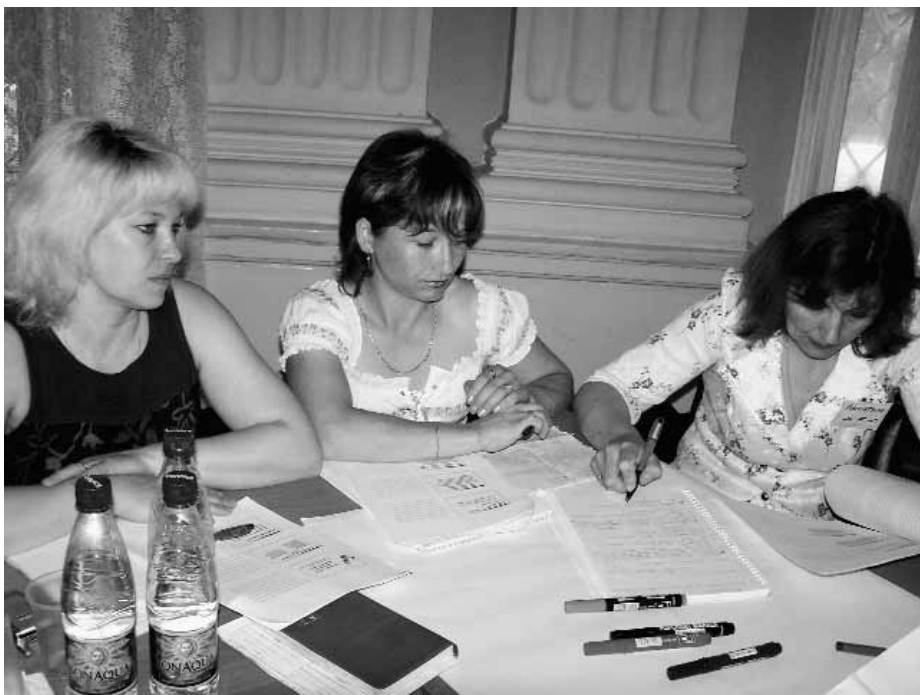
Тренери ВФ «Крок за кроком»

Мета навчальної поїздки — ознайомитися з досвідом діяльності провідних шкіл м. Києва у сфері проектної діяльності, професійного розвитку вчителів і залучення батьків до процесів прийняття рішень.