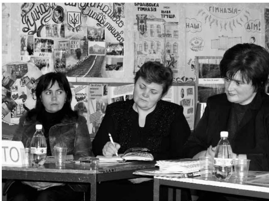
Координатори громадсько-активних шкіл Молдови.