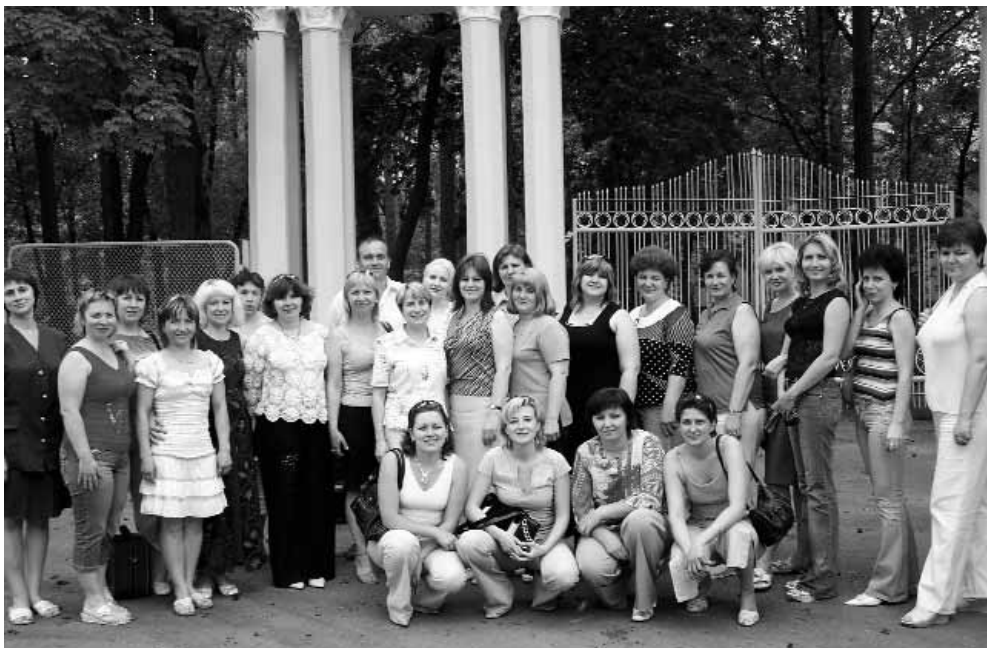
Учасники тренінгу «Удосконалення тренерської майстерності».