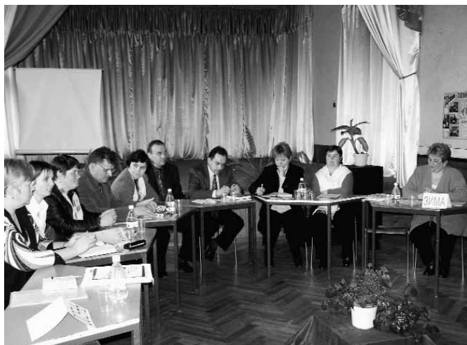
Проведення «круглого столу» на базі Бродівської гімназії ім. І. Труша, Львівська область.