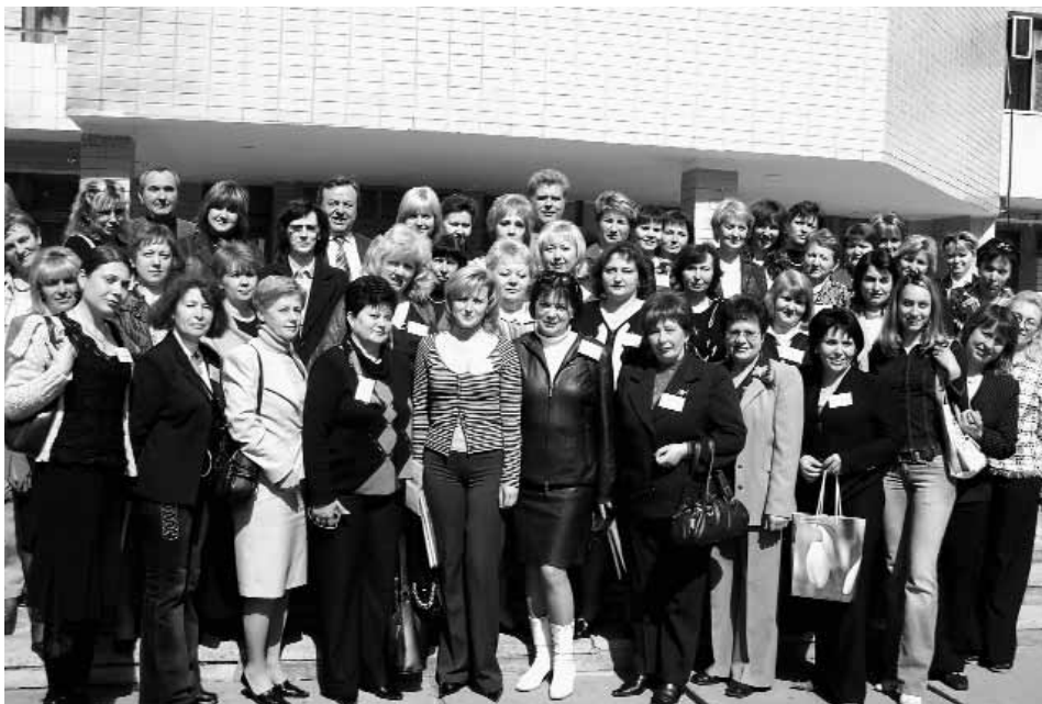
Учасники всеукраїнської конференції «Інклюзивна освіта: стан і перспективи розвитку в Україні»